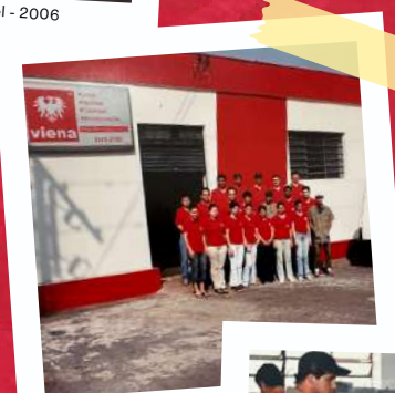
Equipe em 2005