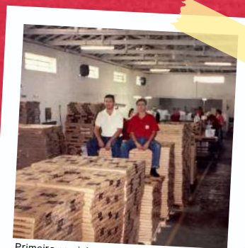
Primeiro caminhão de papel - 2006