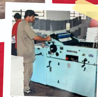
Primeira impressora em 2001